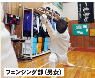
フェンシング部(男女)

柔道場は150畳敷きの広々とした施設で、試合場が2面とれます。剣道場も床はスプリングが効いていて怪我を防ぎます。フェンシング部とダンス部も専用の練習場を有しています。