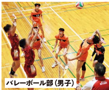
バレーボール部(男子)