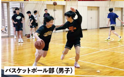
バスケットボール部(男子)

本校には第一体育館と橘記念館の2つの体育館(エアコン完備)があります。第一体育館では男子のバレーボール部とバスケットボール部が、橘記念館では女子のバレーボール部とバスケットボール部が伸び伸びと活動しています。橘記念館の3階ギャラリーには140mの走路があり、校内合宿等で利用できる浴場も設置されています。