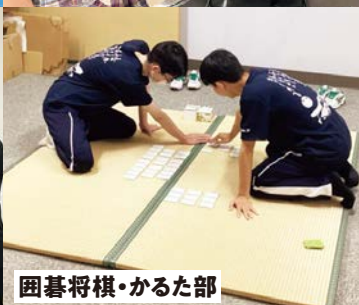
囲碁将棋・かるた部