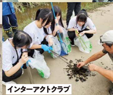
インターアクトクラブ