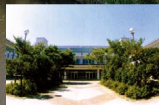
東京学館船橋高等学校