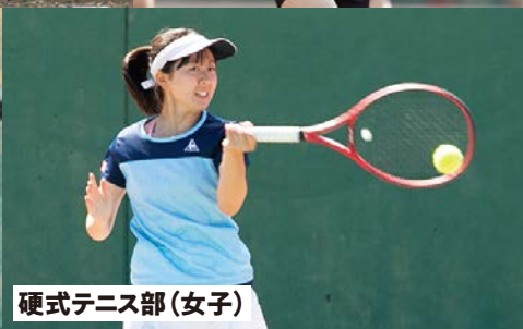
硬式テニス部(女子)