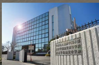
東京学館浦安高等学校