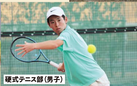
硬式テニス部(男子)