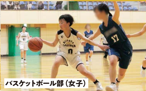
バスケットボール部(女子)