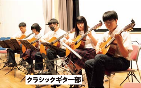
クラシックギター部

西関東大会を目指す吹奏楽部、全国高等学校総合文化祭常連のクラシックギター部、そして合唱部・箏曲部が県大会や各種コンクールで活躍しています。若さで奏でる音楽は人の心を豊かにしてくれます。