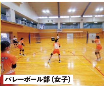
バレーボール部(女子)