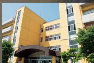
東京学館新潟高等学校